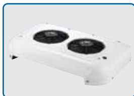
Kondensator chłodzący podczas jazdy