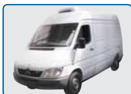
Pojazd z kondensatorem dachowym